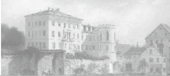
Haus Metzler in Bonames auf einem Gemälde von Carl Morgenstern, 1865