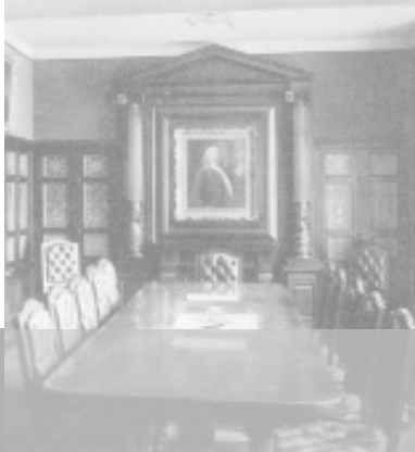
Sitzungssaal im Bankhaus Metzler um 1900