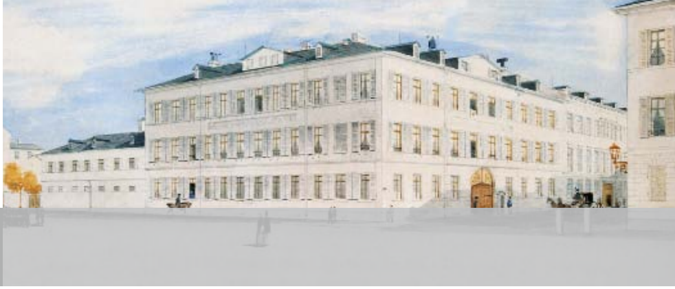
Neue Mainzer Straße 42–44/Große Gallusstraße 18 im Jahr 1849